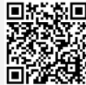
วิธีโอการใช้งานระบบ Inventech Connect

กรณีที่ท่านยังไม่ได้รับ e-Mail ลิงค์สำหรับการเข้าร่วมประชุมฯ และคู่มือการเข้าใช้งานระบบการประชุม e-AGM ดังกล่าว ภายในวันที่ 27 เมษายน 2567 โปรดติดต่อ บริษัท อินเวนท์เทค ซิสเต็ม (ประเทศไทย) จำกัด โทรศัพท์ 02-931-9142 หรือที่ LINE ID : @inventechconnect โดยทันที