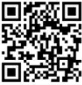
คู่มือการใช้งาน e-Request